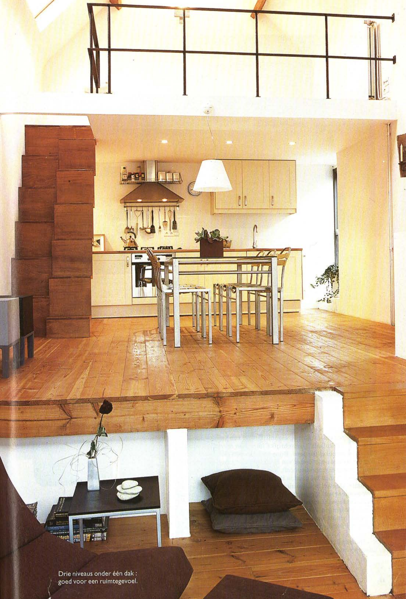
Drie niveaus onder één dak : goed voor een ruimtegevoel.