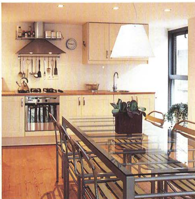
Links de molenaarstrap en rechts de keuken, die door slimme ingrepen toch voldoende licht kreeg.