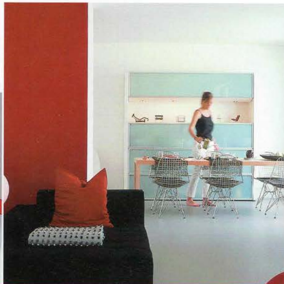
Naast de zitbank (van B&B Italia) laat een nis in de vloer licht sijpelen in het trappenhuis.