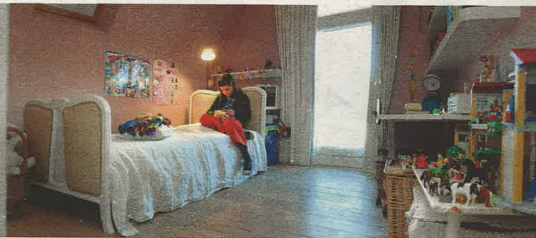
De gezellige slaapkamers van de kinderen op de zoldervedieping.