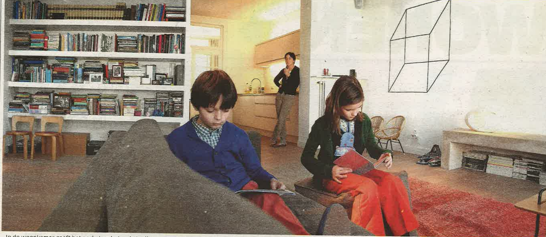
In de woonkamer geeft het parket en het rode tapijt warmte. De eyecatcher is de betonnen bank met de speciale lamp.