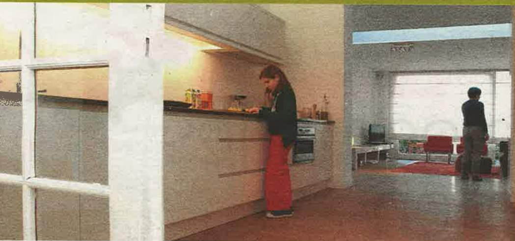
De keuken ligt tussen de woonkamer en de eetplek, als een soort doorgang met kasten aan beide wanden.