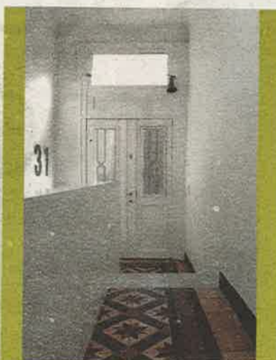
De oorspronkelijke tegels in de gang.

Op de eerste verdieping bevindt zich de 'master bedroom' met badkamer. De slaapkamer is eenvoudig maar heel ruim, heeft een dressinggedeelte dat wat te klein is voor de bewoners en paalt aan een privébadkamer. In de badkamer hangt een oud houten turnrek aan de muur, een originele toets.