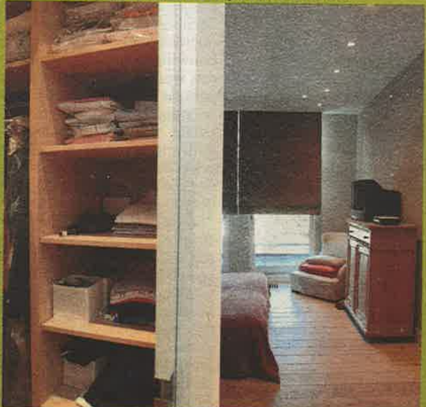
De slaapkamer en dressing, met daarnaast de badkamer. Het oude turnrek is een originele handdoekhanger.