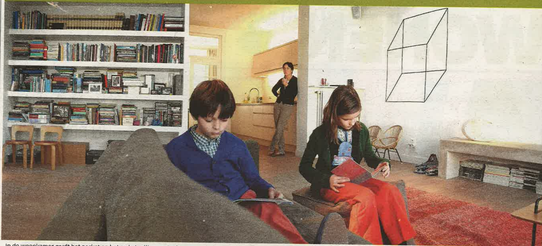
In de woonkamer geeft het parket en het rode tapijt warmte. De eyecatcher is de betonnen bank met de speciale lamp.