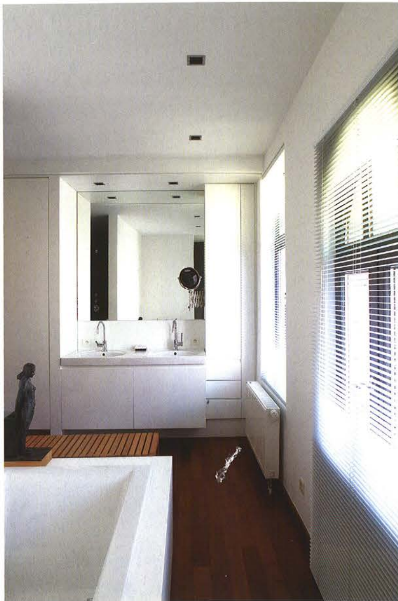
Boven Ook in de badkamer ligt een vloer van eikenhout. De sculptuur werd gemaakt door Gilbert van Acker. Onder Bad Clarissa komt uit de collectie van Sphinx, kraan Tara Classic is een ontwerp van Sieger Design voor Dornbracht (Burgmans Agenturen). Rechterpagina In de slaapkamer creëerde de architect een 'lichtlijn' door achter de boekenplank verlichting in te bouwen.