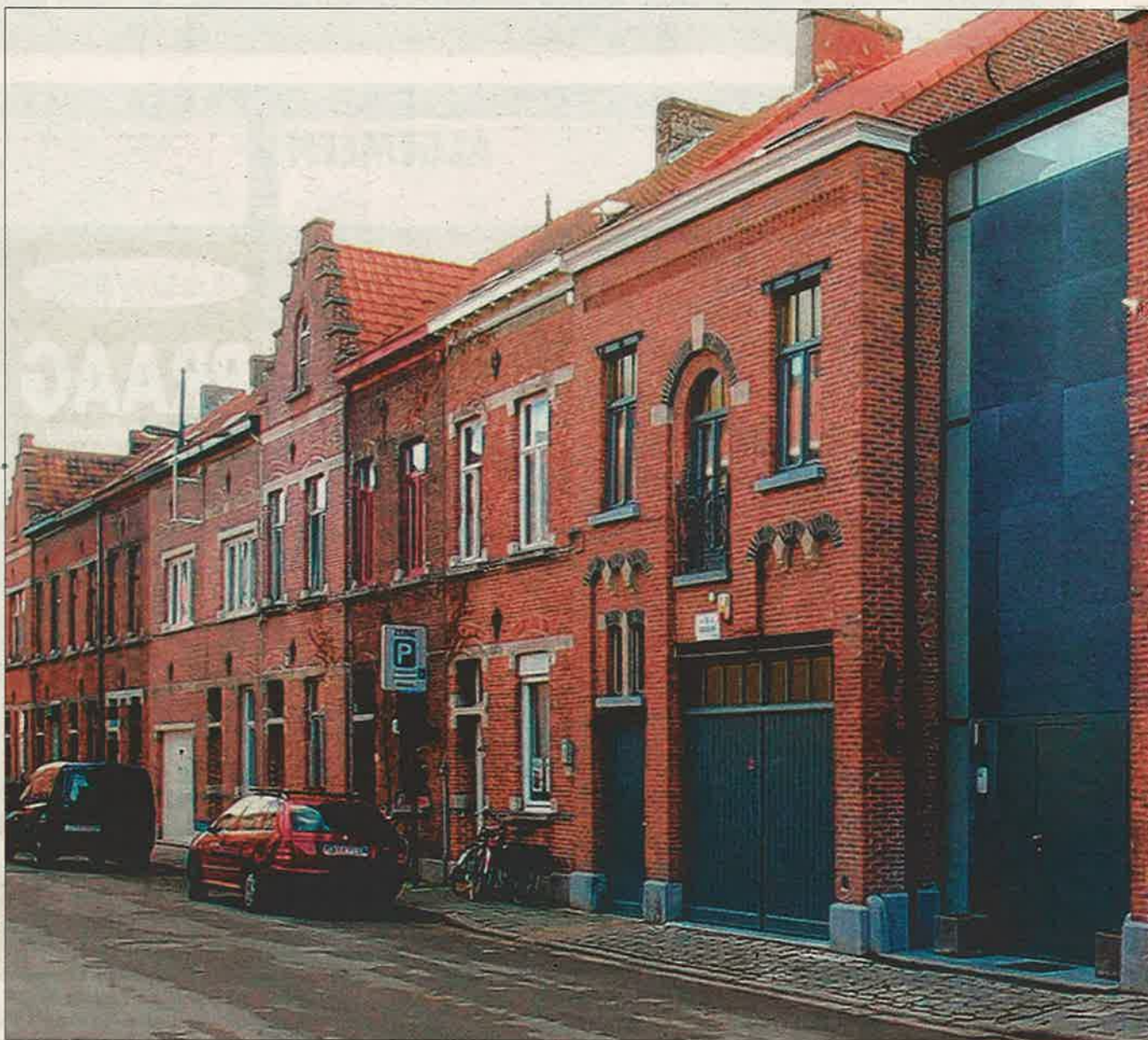
TWEE OUDE HUISJES WORDEN EEN EIGENTIJLDE STADSWONING

► Zit u met een prangende vraag rond bouwen of renoveren? Surf naar www.livios.be . Een professioneel panel formuleert er een oplossing voor uw probleem.